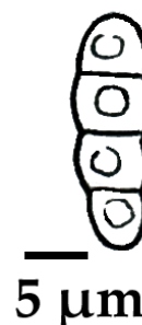
Fig. 3. Aspect des spores d' Opegrapha reactiva (dessin de Enrico Mangini).

Le taxon est initialement décrit par Alstrup et Hawksworth (1990) sous le nom de Kalaallia reactiva Alstrup et Hawksw. Par la suite Etayo et Diederich (dans Etayo et Sancho, 2008) proposent une nouvelle combinaison et nomme l'espèce Opegrapha reactiva (Alstrup et Hawksw.) Etayo et Diederich.