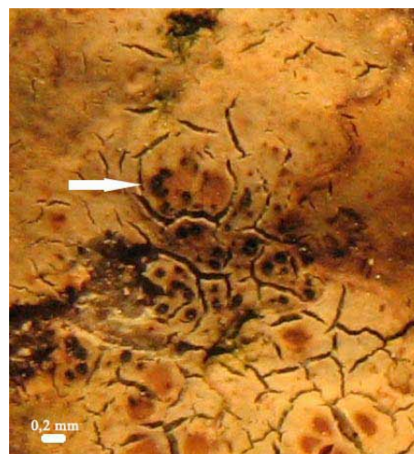
Fig. 1 (à gauche) et fig. 2 (à droite). Périthèces noirs lâchement regroupés (flèche blanche) sur le thalle brun d' Hymenelia lacustris .

des septa (fig. 3), de 17-20 x 5 – 8 µm de dimension.