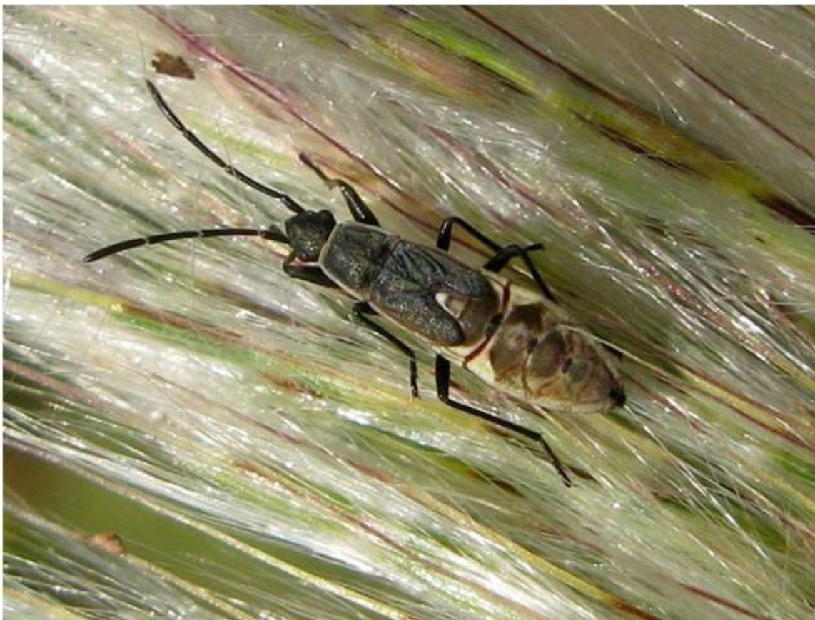
Fig. 3 - Paromius gracilis , larve au stade V.