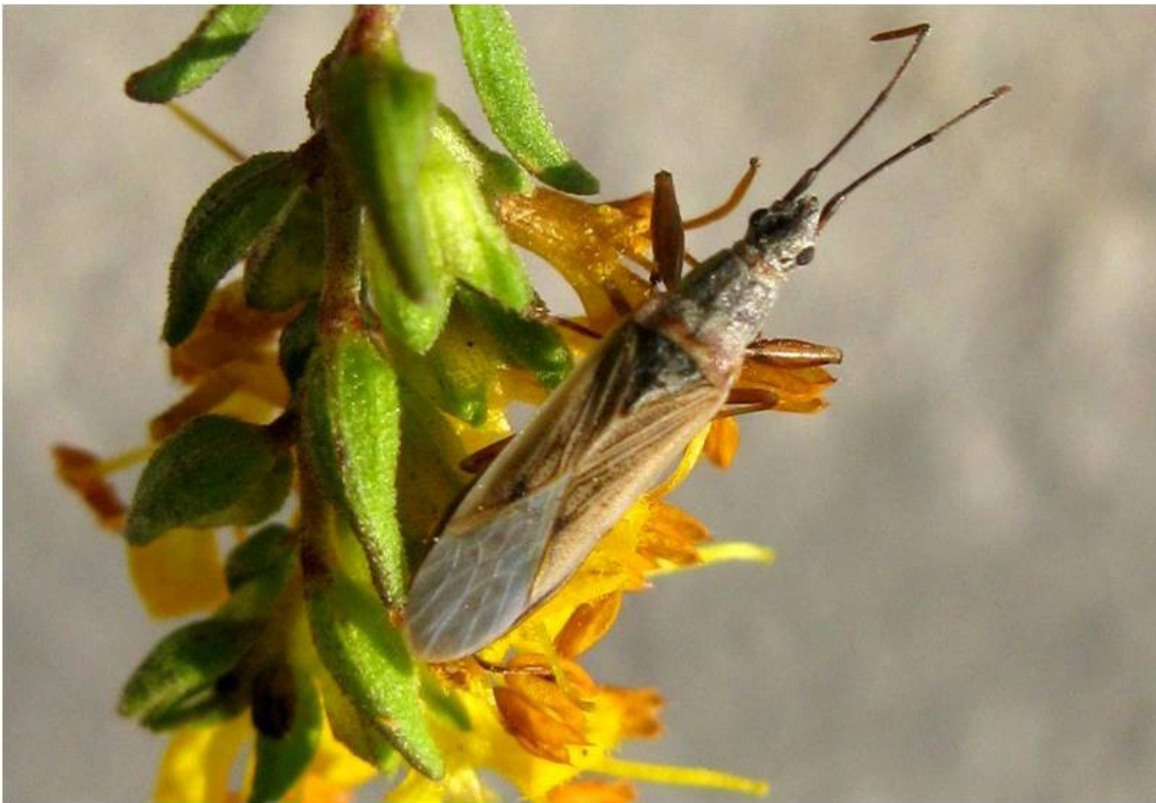
Fig. 2 - Paromius gracilis adulte.