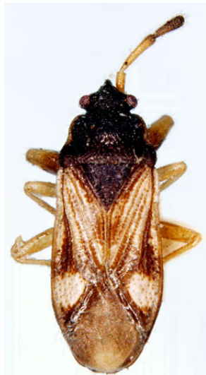
Fig. 2 - Le type de Tempyra biguttata (site www2.nrm.se ).

«le dessous du corps est noir brillant, le dessus et les hémélytres sont couverts d'une légère pilosité ; les antennes, le rostre et les pattes sont de couleur jaune ; le bout de l'article 2 des antennes, le 3 et probablement le 4 ainsi que la moitié des fémurs antérieurs sont sombres ; clavus assombri à l'avant et à l'arrière ; hémélytres d'un jaune sale, très pâle ; la moitié arrière de la corie est sombre et ornée à l'arrière d'une tache blanche arrondie ; la membrane est brun foncé, avec le bout plus pâle ; le ventre est brillant, sans ponctuation ; la tête est ponctuée. Longueur 3 mm, largeur 1 mm.»