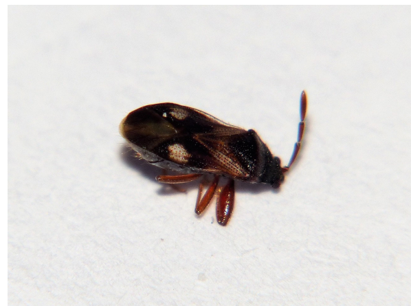
Fig. 1 - Tempyra biguttula de Lunel-Viel.

son logement à Lunel-Viel (Occitanie, Hérault, 34146, N 43°40'19,98", E 04°05'23,79", alt. 12 m). Après l'avoir capturée et photographiée le 20.10.2018 ( Fig. 1 ), il interrogea le forum Insecte.org pour essayer de lui donner un nom. Bariş Çerçi d'Istanbul (Turquie) l'identifia alors comme une espèce nouvelle pour la faune de France : Tempyra biguttula Stål, 1874.